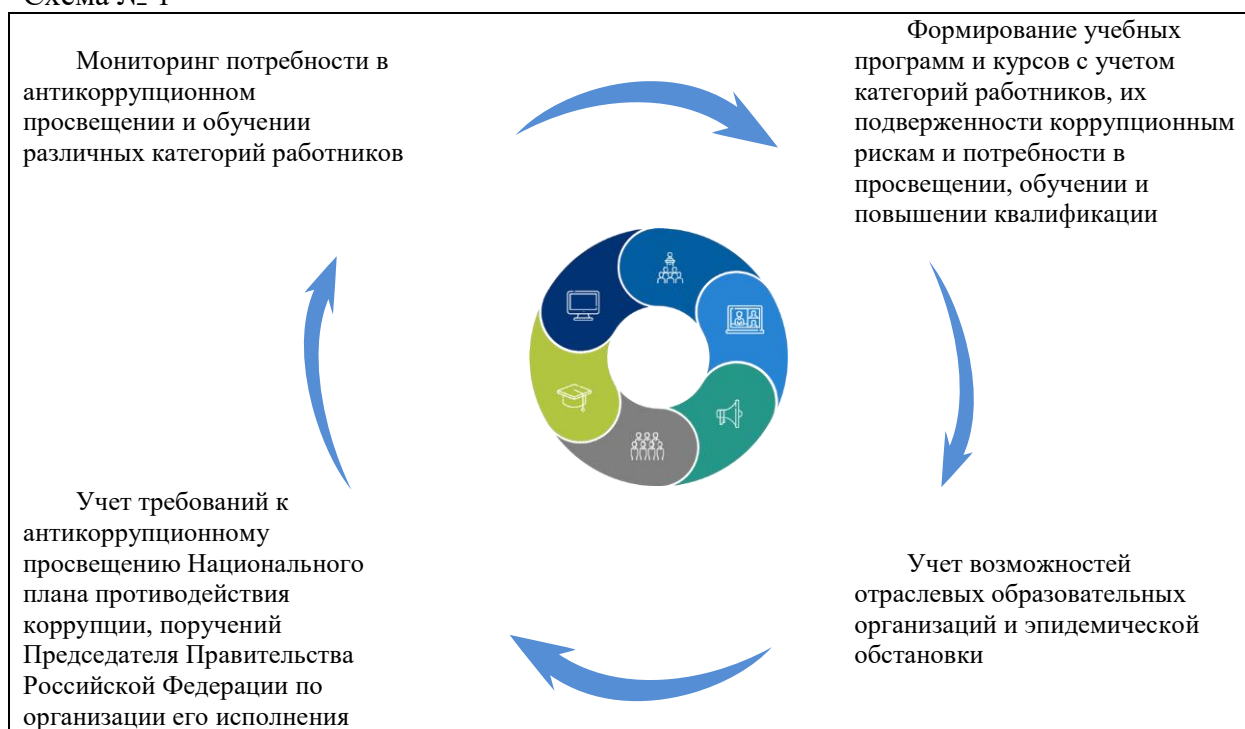
Схема № 1

Основными формами антикоррупционного обучения в атомной отрасли являются: очное обучение; дистанционное обучение; «Антикоррупционные десанты»; отраслевые конференции; иные мероприятия антикоррупционного просвещения.